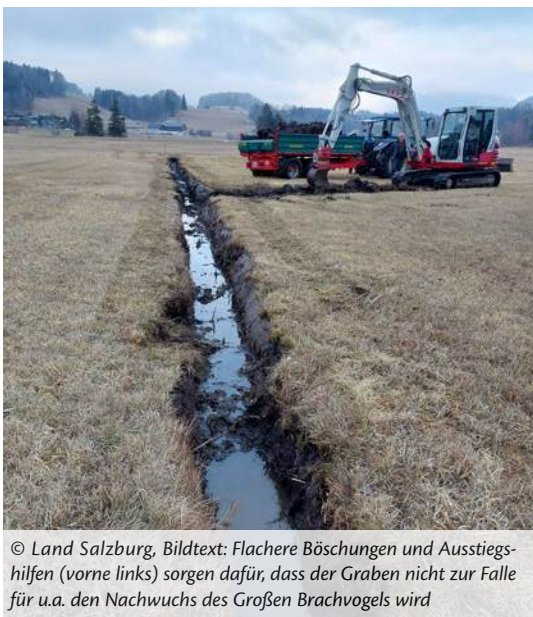
Bildtext: Flachere Böschungen und Ausstiegshilfen (vorne links) sorgen dafür, dass der Graben nicht zur Falle für u.a. den Nachwuchs des Großen Brachvogels wird

Im Winter 2025/2026 nutzten mehrere Landwirte im Naturschutzgebiet Fuschlsee die Naturschutzförderung für eine ökologische Grabenpflege. Da die Streuwiesen- und Niedermoorflächen besonders empfindlich sind, wird der Arbeitsumfang vor Beginn grundsätzlich in enger Abstimmung mit der Schutzgebetsbetreuerin festgelegt. Dabei werden die Maßnahmen gemeinsam mit den Landwirten ausgearbeitet und an die Gegebenheiten vor Ort angepasst. Ziel ist es, die Entwässerungsgräben so instand zu halten, dass eine schonende Bewirtschaftung möglich bleibt und gleichzeitig die Streuwiesen nicht zu stark entwässert werden.